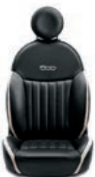
Leder Schwarz/Elfenbein 686/687